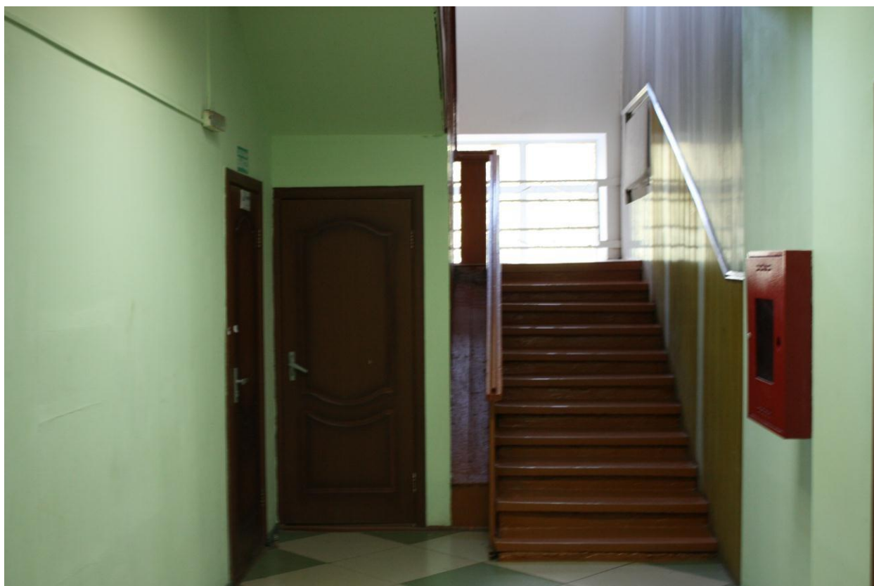
Фото № 12. Лестница внутренняя