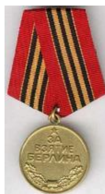
«За взятие Берлина»