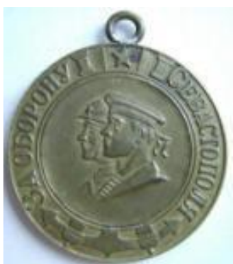
«За оборону Севастополя»