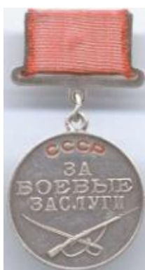
«За боевые заслуги»