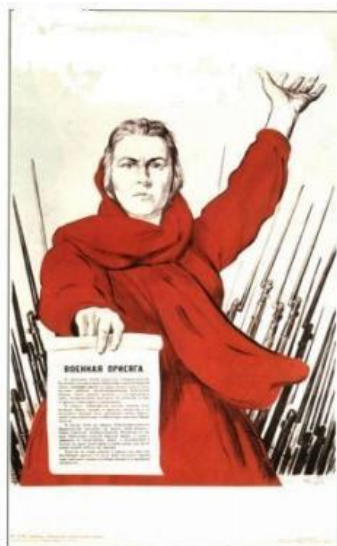
И.М.Тоидзе «Родина-мать зовет!»