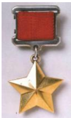
Медаль «Золотая звезда»

Назовите ордена и медали, представленные на фотографиях