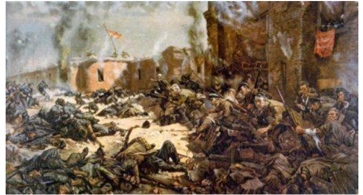
П.А.Кривоногов «Защитники Брестской крепости»