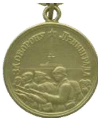
«За оборону Ленинграда»