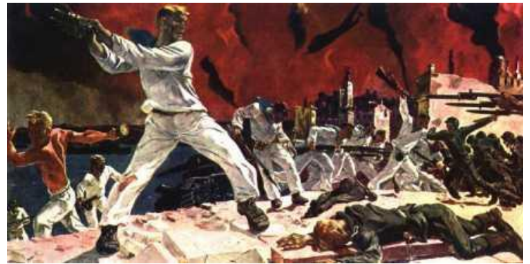
А.А.Дейнека «Оборона Севастополя»