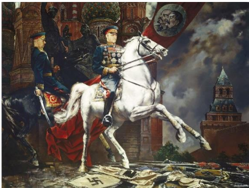
С.Н.Присекин «Парад Победы»